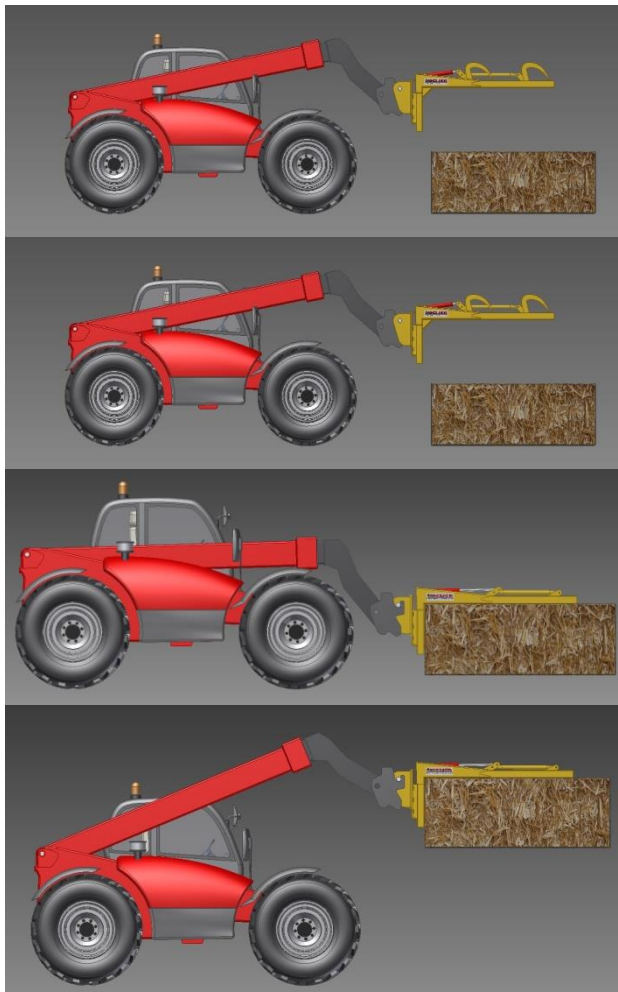
Bedienung Rambo 3